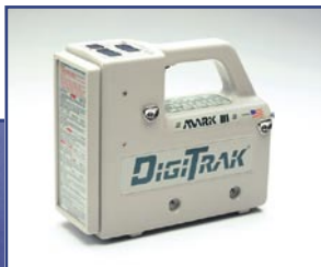
Приемник Mark III (наверху) и кабельная система (слева) сверху вниз: выносной дисплей для работы с кабельной системой и источник питания, стандартный и высокочувствительный к углу наклона кабельный излучатель, инструмент DCI для установки/извлечения.