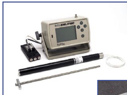
Приемник Eclipse® (справа) и кабельная система (наверху) сверху вниз: выносной дисплей для работы с кабельной системой и источник питания, кабельный излучатель, инструмент DCI для установки/извлечения.