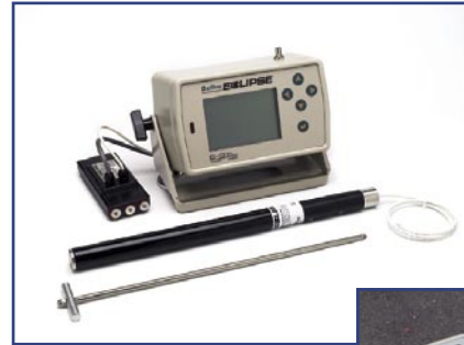
Eclipse® Empfänger (rechts) und Kabelsystem (oben), von oben nach unten, Fernanzeige inkl. Kabelfunktion und Stromversorgung, Kabelsender und Werkzeug zum Aus- und Einbau