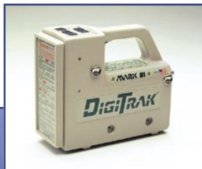
Mark III Empfänger (oben) und Kabelsystem (links), von oben nach unten, Fernanzeige inkl. Kabelfunktion mit Stromversorgung, Standard-Transmitter und 0.1% Transmitter. Ein- / Ausbau Werkzeug